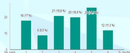
¿Crees que la información de estratificación te ha permitido trabajar de modo más coordinado con otros niveles asistenciales? (106 respuestas)