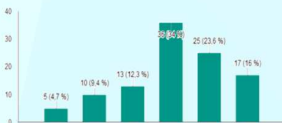
Estoy satisfecho con la comunicación que he recibido sobre la puesta en marcha de la estratificación (106 respuestas)