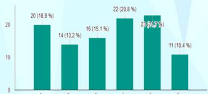
¿Utilizas información de estratificación de riesgos en tu práctica diaria? (106 respuestas)